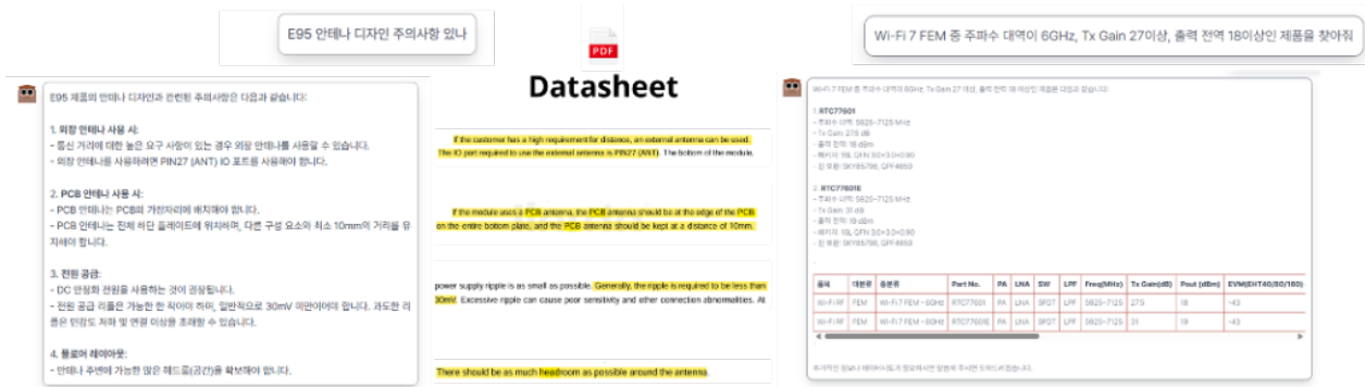
그림 2 문서 탐색 및 응답 기능

- 수요기업이 직접 데이터 등록, 수정, 삭제 등을 수행할 수 있도록 하여 운영 효율성 확보